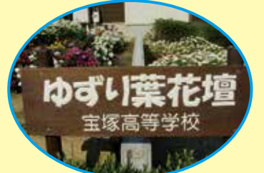
県宝まちなか花壇