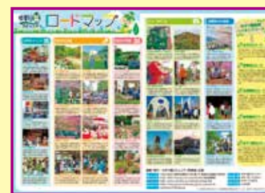
ロードマップ (表面)