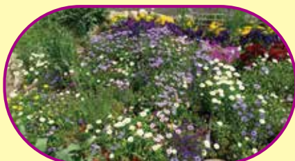
手入れの行き届いた花壇