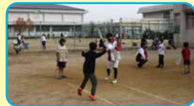
県宝ジュニアテニススクール