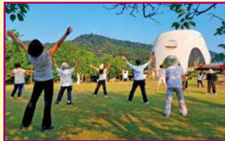
毎朝のラジオ体操