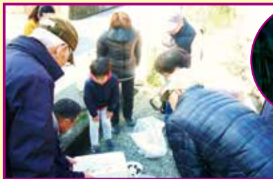
白瀬川のホタルを育てる