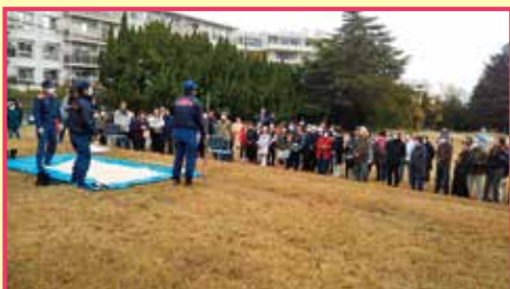
「宝塚ゴルフ倶楽部」への避難訓練

隣の「宝塚ゴルフ倶楽部」への避難を皆で検討し、ゴルフ場と交渉し覚書締結。（芝生の一部、駐車場全面、クラブハウスの一部を開放し、ヘリポートを設置する。）