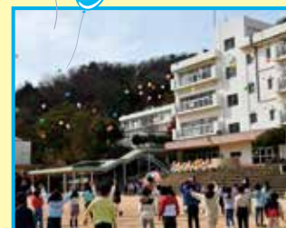
バルーンフェスタ