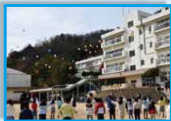
バルーンフェスタ