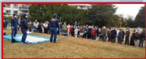
「宝塚ゴルフ倶楽部」への避難訓練