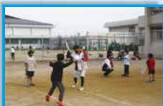
県宝ジュニアテニススクール