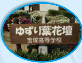
県宝まちなか花壇