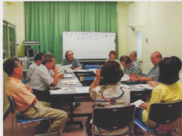
平成15年7月19日(火)発起人会

「健康で、明るく、楽しい、まちづくり」を目指して、地域スポーツ活動を推進しています。