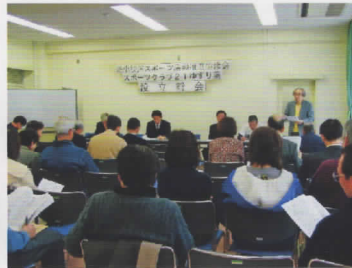
平成16年3月7日(日)設立総会