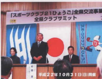
平成22年10月31日(日)開催