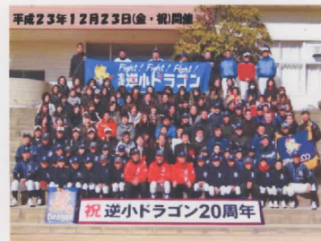
平成23年12月23日(金・祝)開催