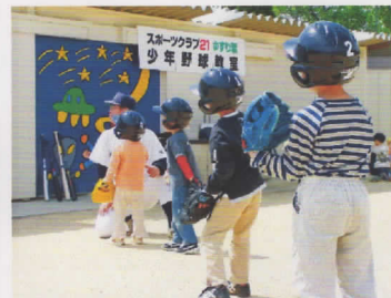
スポーツクラブ21 ゆずり葉 少年野球教室