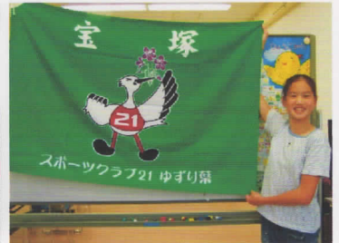
平成18年9月30日(土)国体クラブ旗