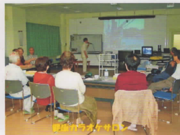
健康づくり歌謡・ハイキング ゆずり葉森の広場 毎週日曜日集合