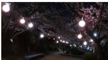
さくら祭りライトアップ