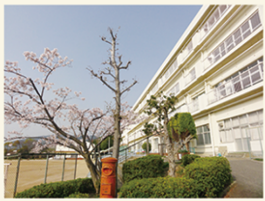
逆瀬台小学校校舎

今年、新型コロナウイルス感染症のために、学校閉鎖から始まって、6月からは分散登校となりました。夏休み、冬休みも短縮され、学校の授業時数は、なんとか確保できている状況です。しかし、子供たちにとって残念だったのは運動会や音楽会などの学校行事がなくなり、また地域行事も中止となって、楽しみな行事が無くなったことです。授業と共に、行事への取り組みを通して、子供たちの成長を促進してきた学校としても、残念でなりません。残り期間は少ないですが、なんとかその影響が少なくなるように取り組んでいきます。5年間という短い間でしたが、皆様のご協力・ご支援のおかげで学校を運営してきました。職員の逮捕などご迷惑をおかけして、学校へのご意見等も多々あったかと思えます。十分にお答えできたかどうかはわかりませんが、ご容赦願います。地域全体が高齢化して、学校への支援体制が難しい中、コミュニティースクールへの課題もあります。地域の学校として、これからも逆瀬台小学校をよろしく願います。5年間、皆様には本当にお世話になりました。