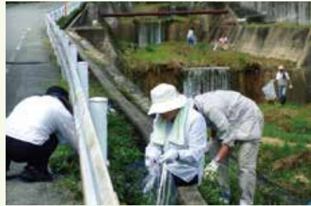
白瀬川クリーンハイキング風景

こうして今の素晴らしい住環境のまちが完成しました。つまり山と川に囲まれた土地を切り開いて開発された閑静な住宅地です。よって当地域には、歴史的な神社、仏閣はなく、（隣接地域に辛うじて、聖天さんがあります。）地域を歩いて楽しむような