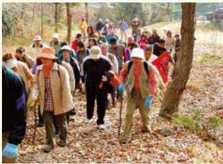
里山ハイキング風景

と、④裏山コースの道標ポイント、⑤ビューポイントの説明、⑥裏山ハイキングの代表的な基本コースと距離等を、表面・裏面に分かりやすく図示し、説明しています。（マップ図参照）皆さんも、コロナ禍でステイホームの毎日をご過ごしいらつしやると思います。