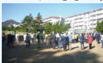
宝塚ゴルフ倶楽部への避難訓練