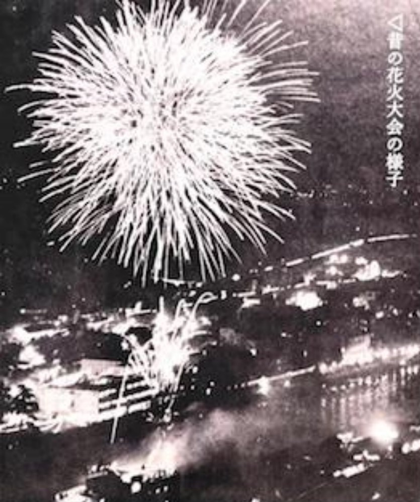
△昔の花火大会の様子

宝塚での花火大会は大正2年(1913年)に温泉街の集客のために始まり、8月に宝塚大劇場近くの武庫川観光ダムで開かれてきました。しかし現在は様々な事情により2015年を最後に「休止」となっています。こうした状況を打ち破るには、「市民の力」で花火大会を開催する必要があると考えました。 今回は小さな花火ですが、将来の復活に向けた一歩になると信じています。そして、これが100年以上続く伝統の花火大会復活を望む多くの市民の想いを、なく「きずな花火」となることを願っています。 (第1回宝塚きずな花火実行委員会)