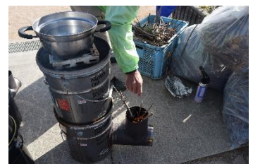
ロケットストーブの実演