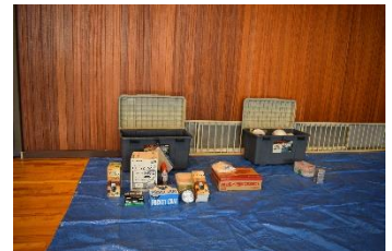
現在の防災用備蓄品