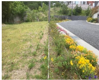
こんなキレイになりました