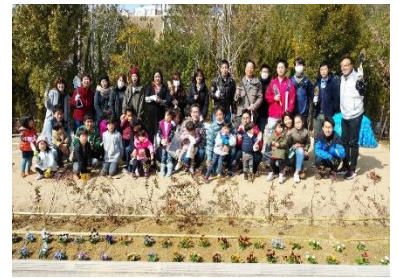
花植え当日の集合写真♪