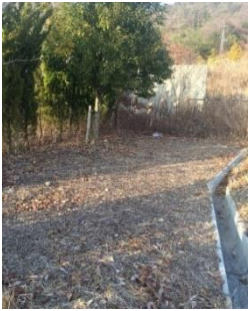
もともとは荒地だった場所

北公園からの眺めに負けず劣らず、自治会館からの眺めも最高です♪是非お立ち寄りください！