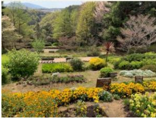
オープンガーデンフェスタ