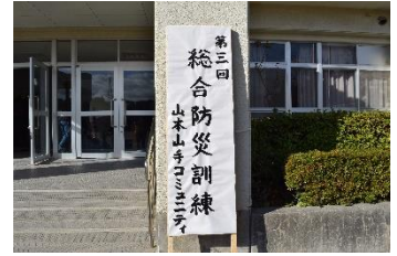
今回で3回目の総合防災訓練

なお、この「総合防災訓練」は『公益財団法人ひょうご震災記念21世紀研究機構』と『ひょうご安全の日推進県民会議』の助成を受けて実施いたしました。