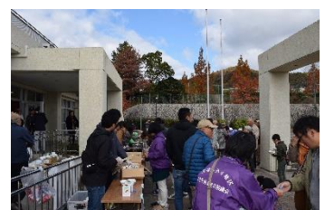
アルファー化米とカレーの試食