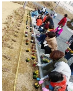
みんなて花を植えました！