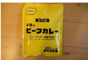
7大アレルギー物質不使用のレトルトカレー