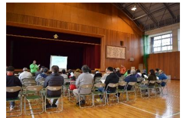
防災訓練の一コマ