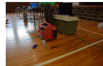
発電機の実演(スマホを充電)