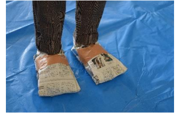
新聞紙を使用した靴カバー