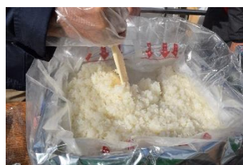
アルファー化米の実演