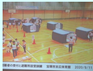
過去の避難所訓練の様子

過去の事例より、避難情報を聞いていた人も避難のきっかけは近所の方の「逃げよう！」の声掛けが多かった事がとても驚きました。避難所は学校だけが避難所ではない、他の施設や在宅避難も検討・・・など印象に残りました。避難所開設がどのタイミングなのかもう少し詳しい話が聞きたかったという意見も出されました。間仕切り板やテントも数セット各避難所には配備されています。