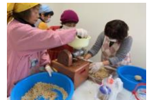
毎年大人気の味噌づくり (昨年度の様子)