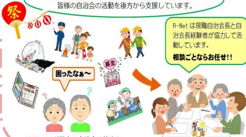
R-Net に所属する自治会の皆さん