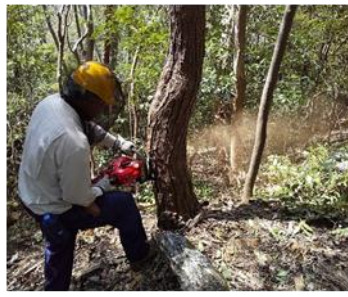
赤松植樹地付近の枯れ松伐採