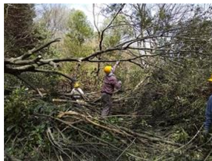
倒木ヤブニッケイの処理