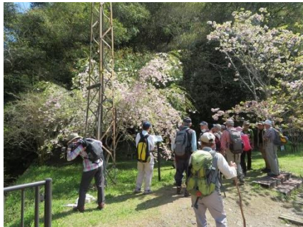
満開のヤエベニシダレも鑑賞

このうち、シュンランは東屋での解散後に見つかりました。せっかくなので、リストに加えさせていただきます。また、案内役の私がなかなか名前を思い出せなかったのは、カテンソウ（イラクサ科）でした。参加者の皆様のご協力で、とても楽しく有意義な時間を過ごすことが出来ました。どうもありがとうございました。