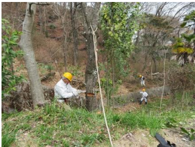
青葉台口川岸の枯れ桜の伐採

3/28 (木) 天気予報では午後 3 時頃から雨だったため、参加者がやや少な目で 2 班で作業しました。1 班は青葉台口の枯れ桜 1 本の伐採と、光ガ丘ルート入口で笹、細竹や灌木の除伐、刈り取り、更に小林大堰堤民家側植え込みの剪定を行い、他班はキツネの森で大径の枯れ松 2 本の伐採並びに逆瀬台小学校北側斜面で中サイズの枯れ松 3 本を伐採しました。(加賀野 記)