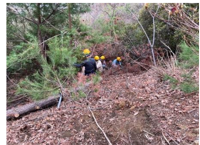
キツネの森南端急斜面に枯れ松を伐倒、急斜面底部にて枝葉処理