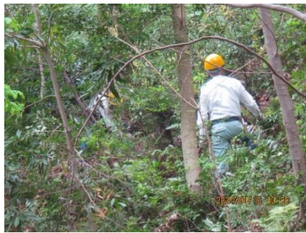
斜面でのシダの刈り取り

今日は、北斜面平地に雨水を受ける貯水槽を設置しました。植樹した桜に夏場水をやるためです。桜を植樹した周りのクズ根の掘り起こしおよび植樹地周囲の除伐も引き続き行いました。桜の谷西側斜面でのシダや常緑低木等の除伐も行いました。また北斜面水平道付近では、近隣住民の方の要望もありヤシャブシの伐採を行いました。(岡 記)