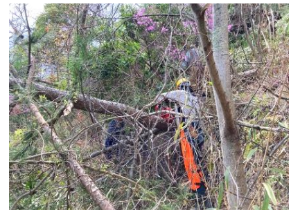
ゆずり葉ピーク西側急斜面枯れ松伐採し、玉切