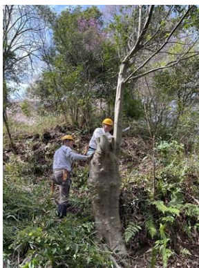
萌芽したナナミノキの間伐

4/20 (土) 山は鮮やかな新緑に包まれています。塩谷ルート of 北側斜面の常緑樹処理の継続で、チェーンソーで太い木を倒して日当たりを良くしました。こちらも前回の継続で倒れたヤブニッケイの幹と枝をチェーンソーで処理しました。1 本の木とは思えない大量の丸太が並びました。南ピーク周辺にて温泉祭りで子供たちに切ってもらおうヤブニッケイの丸太を調達しました。サイズと形の良い木を探すのに手間取りましたが午前中に確保しました。残りの時間は周辺の常緑樹を間伐しました。(横山 記)