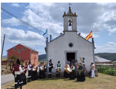
小さな村のお祭り

もう一度訪ねてみたい都市はどこかと尋ねられたら、私は迷わず「サンチャゴ・デ・コンポステーラ」と答える。街全体が世界遺産、この街を訪れる世界中からの人々、ホスピタリティー溢れる地元の人たち、そして新鮮な魚介類と美味しいワイン、全てが素晴らしい。