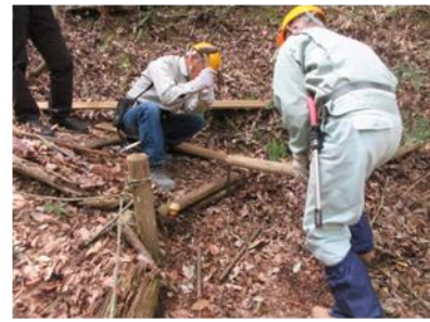
城ヶ丘広場～隔水亭間の階段腐朽した横木を更新