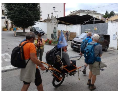
一輪車を牽くボランティア巡礼者