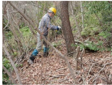
キツネの森南斜面の枯れ松伐採