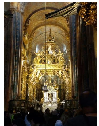
ボタフメイロ（振り香炉）

歩き始めて34日目にサンチャゴ・デ・コンポステーラ到着。アルベルゲで洗濯し、少し休んでから巡礼証明書を貰いに行ったら、何とその日の1000人目の到着でした。千人ならぬ仙人になってしまった。サンチャゴ・デ・コンポステーラに行くなら、「ガリシア民族の日」「聖ヤコブの日」となる7/25がおすすめです。何度来ても素晴らしいサンチャゴ・デ・コンポステーラ大聖堂、正午にボタフメイロ（巨大な振り香炉）で巡礼者を祝福してくれます。