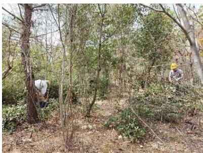
どんぐりの丘で常緑樹間伐

4/5 (金) 活動地に着くと、ご神木のオオシマサクラ等多くの開花した桜に出迎えられました。3 班に分かれ ① 1 班はどんぐりの丘で常緑樹の間伐と園路周りの落ち葉を掃き出し猪被害の防止を、② 2 班は刈払い機等でコバノミツバツツジの丘回廊南側部と、立体駐車場と南斜面間の園路脇部の笹や灌木の刈り取りを、更に ③ 3 班はゆずり葉ピーク西側急斜面の大中 9 本の枯れ松伐採を行いました。(加賀野 記)