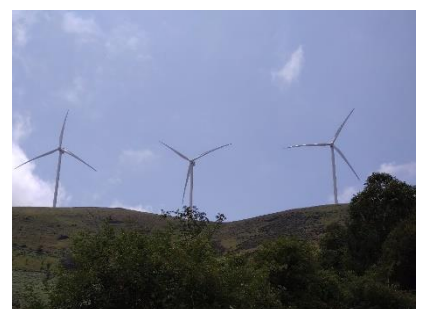
風力発電タービン

スペインは再生エネルギー大国、とても日本ではお目にかかることのない風力発電タービンが山の尾根に延々と続いています。全土に風力発電制御所が設置されているそうです。電力節減が徹底しているから、トイレの照明は殆ど人感センサー付き、じっとしていると30秒くらいで真っ暗になってしまう。トイレでは、時々ハローと手を振るかバンザイするのが鉄則。モンドニエードという村で、障害者を一輪車に乗せて、巡礼するボランティアの一団に出くわしました。これがキリスト教の愛の世界かなと感動。