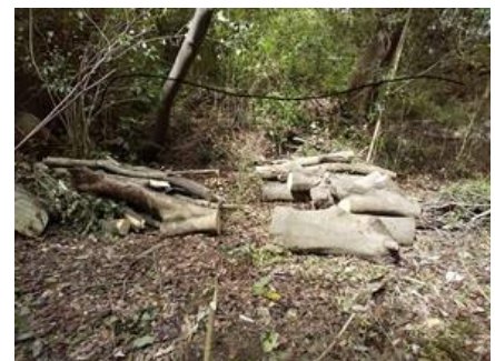
大量のヤブニッケイの幹と枝