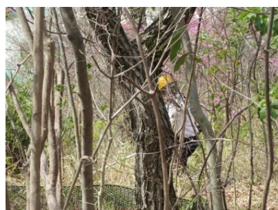
コバノミツバツツジの丘南斜面刈払い機で笹等刈取り