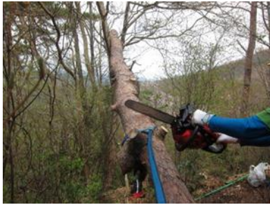
アクラ分岐付近で掛かり木になっていた枯れ折れ松を処理