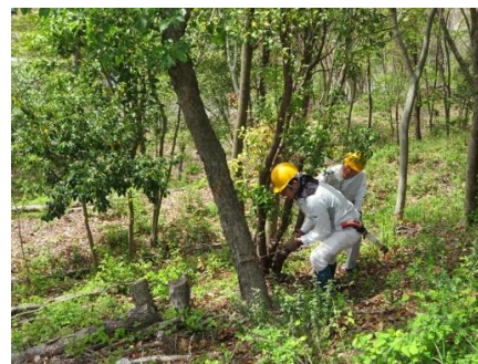
北斜面でヤシャブシ伐採枯