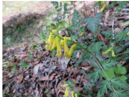
桜の園のミヤマキケマン