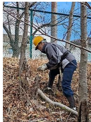
北斜面山手台住宅地沿い；桜の間伐

1/16(火) 新年初めての活動日ですのでまず安全祈願をした後で作業に入りました。北斜面上部の山手台住宅地側では、枯れ松伐採・繁茂した木の間伐に加えて密生した桜の間伐を行い、明るく見通せるようになりました。北斜面水平道では、太陽光パネル設置地域の上部で枯れ松やヤシャブシの伐採・繁茂したツル類の除伐を行い道路からの景観もよくなりました。北斜面平地では、2月に桜を植樹する穴掘りがようやく完了しました。また植樹地周囲の除伐も進んでいます。ここには2～3年後に追加で桜の植樹をする予定です。(岡 記)