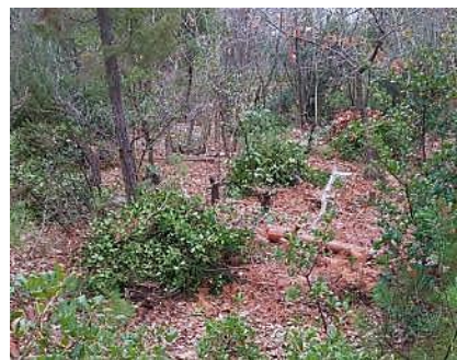
ドンダリの丘でウバメカシ等 常緑樹のヒコバエを刈り取り