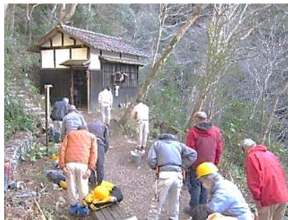
12/24 一年間の無事をお礼

12/24(日) 本年最後の活動日は、年末の寒さを感じる天候となりましたが、新しい年を迎える準備作業を中心に行ないました。どんぐりの道、城ヶ丘広場下の森を暗くしている常緑灌木を間伐し明るくしました。継続して実施してきたモミジの谷のアオキをほぼ皆伐することが出来ました。隔水亭周辺の清掃を実施しました。