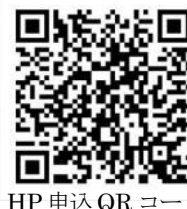
HP 申込 QR コード