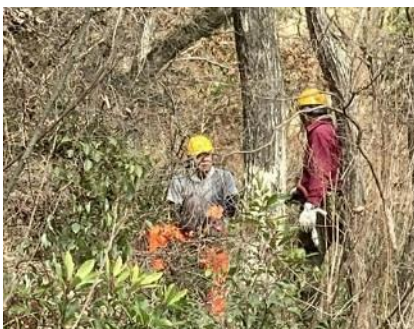
イチヤクソウの丘で 大径の枯れコナラを伐採