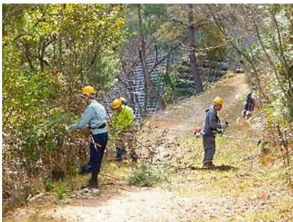
青葉台口園路脇 灌木刈り取りと草刈り