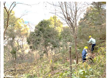
塩谷ルートの常緑樹処理

堰堤付近の園路沿いに茂っているササ、アオキ、ウラジロを処理して見通しを良くしました。作業後はお供えしたお神酒をみんなで分けて頂戴しました。(横山 記)