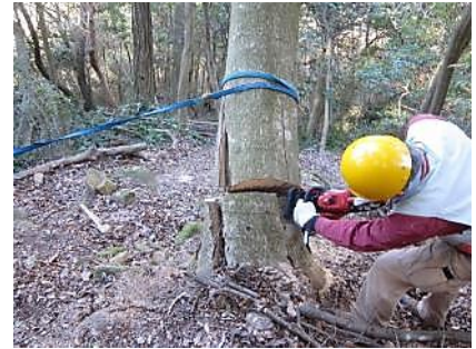
1/11 ササラ沢上部、倒木の伐採