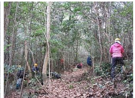
12/24 どんぐりの道、灌木の間伐