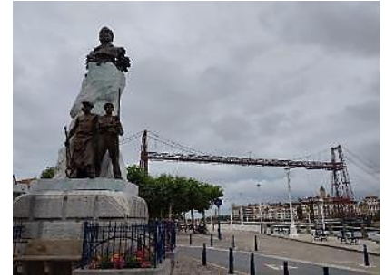
世界遺産のビスカヤ橋