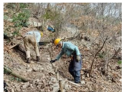
光ガ丘ルート第二丘手前 路肩を改修