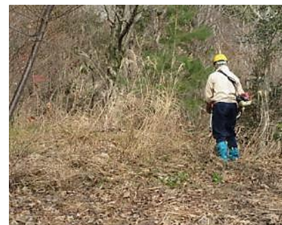
西高グラウンド下平で ススキ等を刈り取り