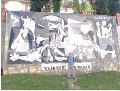
ゲルニカのピカソ陶板による複製

動物だと思います。ビルバオでグッゲンハイム美術館と美食を楽しんだ後、世界最古のビスカヤ橋（運搬用吊橋）のあるポルトガレテに到着。ここまで約175km、約8日の行程でした。いよいよ隣のカンタブリア州に入ります。