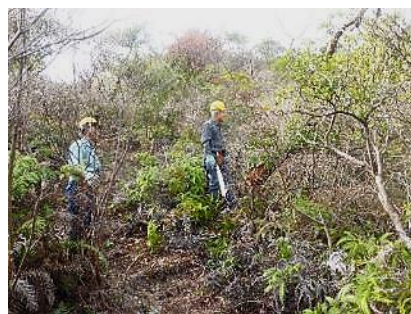
行者山登山路小林堰堤上～合流点 大径枯れ松伐採