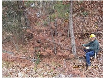
北斜面中川大橋側；枯れ松伐採

12/19(火) 今年は、1回の雨天中止を除き11回の活動が大きくなけがもなく無事終了しました。今日は新年を迎え大階段の落ち葉の清掃、ご神木周りの除伐および枯れ木の伐採、中川大橋近くの枯れ松の伐採・繁茂した樹木の間伐を行いました。すっきりした景観になり明るい新年を迎えられそうです。