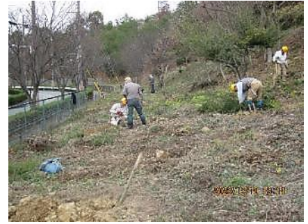
北斜面平地；手分けして桜植樹の穴掘り

課題の北斜面での桜植樹の穴掘りは大きな石を掘り起こす作業も交じり大変でしたが、最終目標17個の穴掘りもあと2個を残すのみとなり来年2月には何とか桜を植樹するめどが立ちました。