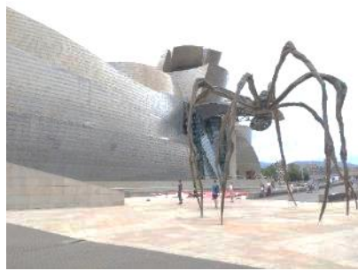
グッゲンハイム美術館