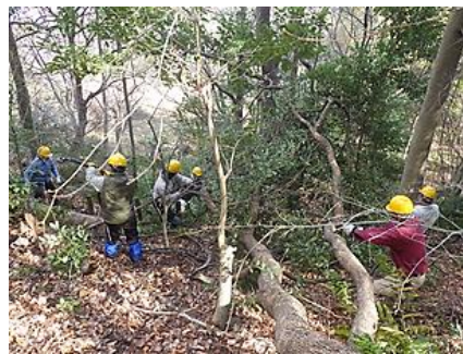
クスノキの枝葉処理

1/7(日) 会としても今年の作業初めで多くの参加がありました。作業前にFM宝塚の電話取材に全員であいさつ声を届け、山の神様に安全祈願をしてから作業を始めました。塩谷ルート沿いの常緑樹の処理と高木の伐採をしました。急斜面での作業でしたが土留めもしながら日当たりを良くしました。武庫山ルートの簡易