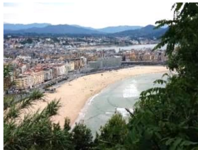
美食の街サン・セバスチャン