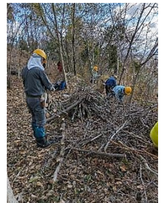
北斜面水平道；枯れ松・ヤシャブシ伐採