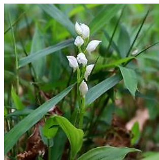
ギンラン (ネットより)