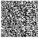
スポーツクラブ21 山手台QRコード

『スポーツクラブ21』とは、小学校区内の子どもから高齢者までの誰もがスポーツを楽しむことができ、スポーツ活動を通じて、地域住民の健康増進と地域の活性化及び青少年の健全育成を図ることを目的に、兵庫県が平成12年度より兵庫県内の各小学校区で実施されている事業です。まずは、お気軽に見学・体験にお越しください。