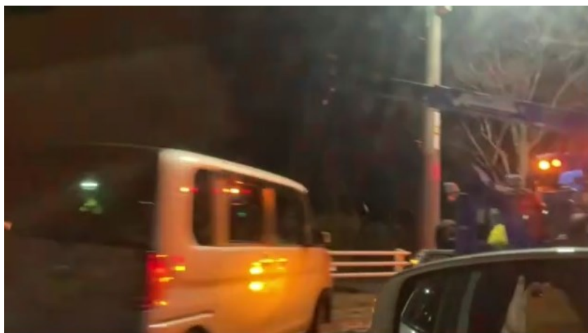
事故車両(軽ワンボックスカー)

2月15日夜8時～9時頃に軽ワンボックスカーがセンターラインを超えて来た対向車を避ける為か、居眠りわき見運転か分かりませんが、左にハンドルを切り、歩道に乗り上げ、ガードレールに追突し停まっていた。 9時半には既にパトカーと牽引車が来て片側交互通行となっていました。