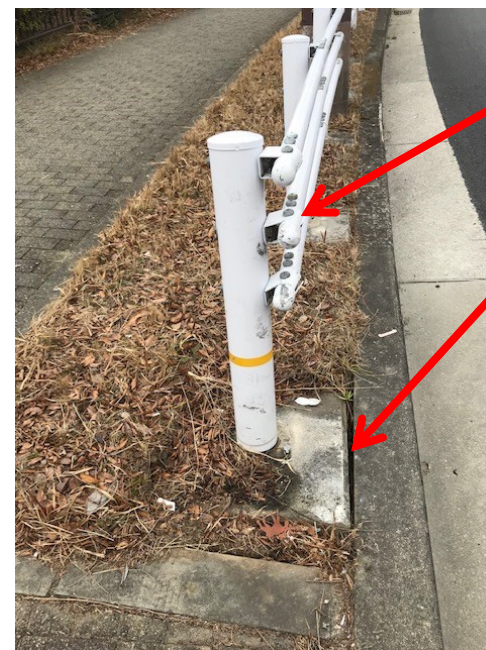
衝突されたガードレール