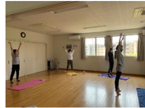
過去のストレッチの様子