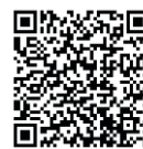
まちづくり計画 QRコード

HPアドレス: 18_yamamotoyamate.pdf (city.takarazuka.hyogo.jp)