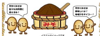
イラストイメージです