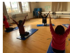
過去のストレッチの様子