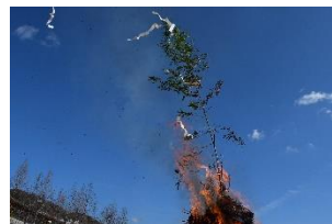
過去のどんど焼き