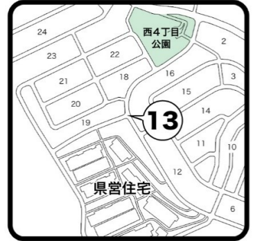
⑬山手台西4丁目県営住宅北側