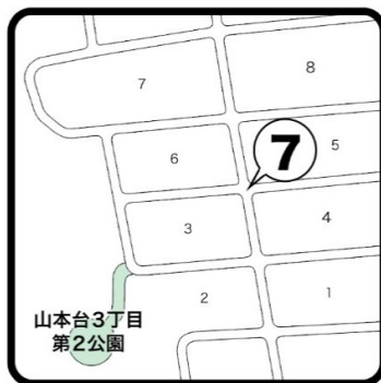
⑦山本台3丁目6の南の十字路