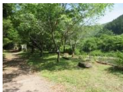
6/2 廃線敷入口広場・作業後