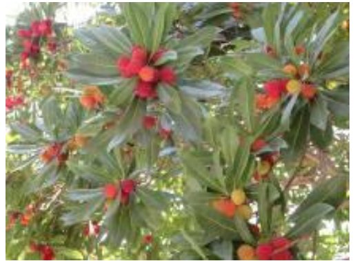
2020.6.16 山手台・あじさいロードのヤマモモ 山手台地区には多くのヤマモモの木があります。 大きな実はリキュールの材料に最適です。