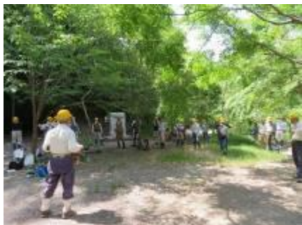
6/2 親水広場に分散して朝礼

約2ヶ月と長かった新型コロナウイルスの感染拡大対応の緊急事態宣言が、5月下旬に解除され最初の櫻守の会の活動が廃線敷草刈となり、活動再開を心待ちにしておられた会員35名が参加されました。草木は2ヶ月の春季中に逞しく成長し、背の高いイネ科の草などは1.5m程にも伸びていました。まだまだ新型コロナウイルス感染の恐れも高く、会員は三密を避け廃線敷宝塚市側全域に分散し、刈払い機8台・鎌・立ち鉋を使って石垣面を含む園路の草刈に汗を流しました。久しぶりの活動とあって全員が相当疲労困憊された様子でしたが無事全域の草刈ができ、歩き易く見晴らしのよい廃線敷となりました。本当にお疲れ様でした。 (加賀野)