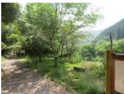
6/2 廃線敷入口広場・作業前