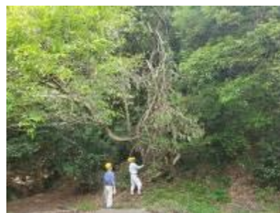
6/5 リンボク広場折れたフジツル