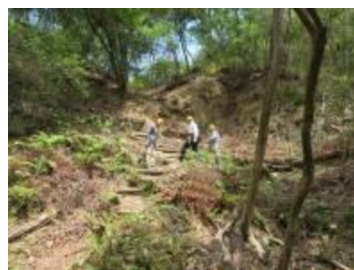
6/9 モチツツジの谷上部の階段補修