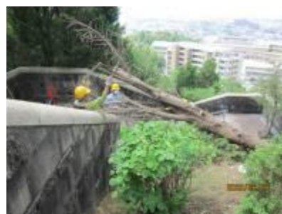
大階段上部での倒木処理

新型コロナの影響で自粛していたため久しぶりの活動です。幸い梅雨の中休みで、天気にも恵まれさわやかな風もありました。アジサイロードや南斜面ではアジサイが見頃です。大階段上部でレイランドヒノキが根元から倒れ、その処理が予定外の作業でした。(6/16 岡)