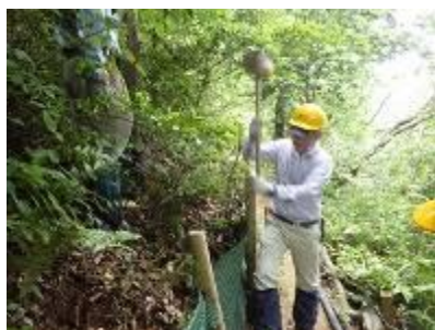
杭を打ち直して斜面の土留め ビューポイント(武庫山 6/20)