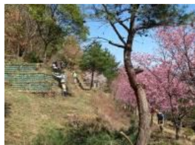
3/25 ほぼ満開の陽光桜を背に展望所草刈

ほぼ満開の陽光桜などを愛でた後、陽光広場では草刈りと桜周辺の常緑樹の間伐、枝打ちを行いました。また湧水路周辺とキツネの森入口で階段、路肩の整備を、光が丘ルートでは枯れ松の伐採、行者山倉庫裏付近ではツクダジイ、マテバシイ各1本の植樹も行いました。作業後には展望所で花見の宴を行いました。(3/25 加賀野)