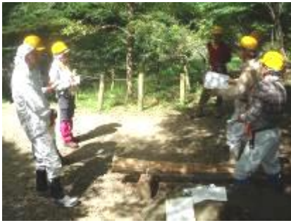
親水広場で基礎研修