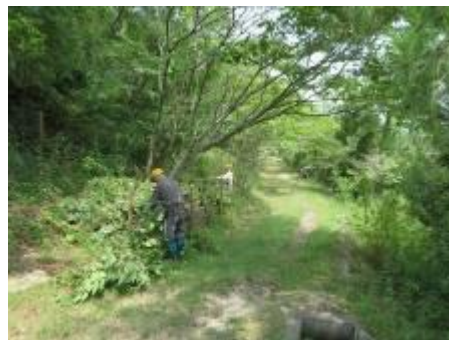
園路入口路のアカメガシワ等の幹の切り詰め

予想最高気温は34℃にも関わらず、17名が広場に集合。第1班7名は園路入口北側斜面でアカメガシワを主体とした木の幹の切り詰めを行った。園路沿いに数年前に植樹したイロハモミジが陽光を求めて南側に枝を伸して来ており、これを矯正するのが主目的。作業は午前中に終了したので、午後は行者山登山道両脇の草刈などの整備をした。第2班の3名は徐々に傾いて来た倉庫のレベル調整をした。持込んだジャッキを使用し、午前中に作業を終了。しかし、基礎の地盤整備が十分に行われておらず、数年後に問題の再発が懸念される。第3班5名は湧水路上に架けた橋の上側の土留め工事を行った。作業は次回完了予定。第4班2名は刈払機を使用して陽光広場の園路と陽光桜林床で草刈。1時半に全ての作業を終え、広場の木陰で汗を乾かし散会した。