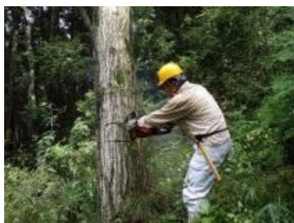
桜坂上部 枯れコナラ伐採