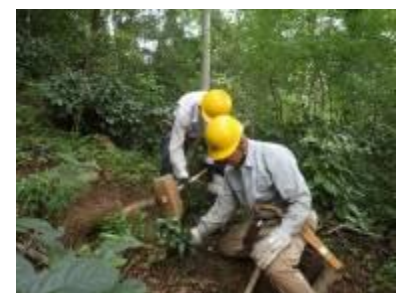
宝松苑道上部の園路整備

園路近くの比較的まっすぐ伸びた5~6cmΦ位の樹(樹名分らず)を2本伐採、横木と杭を作り、ヌタ場の横辺りに4段、更にプラ階段のついている急斜面から少し下ったところに7段のステップを作った。上