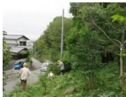
東側道路フェンス際の草刈り

刈払い機(中段、集合広場)と手刈りで入口広場の草刈りをしてスッキリした。北側フェンス沿いは、午前中はフェンス沿いの草刈りと斜面のササ刈りをして植樹の周辺を中心に綺麗にした。午後からは斜面に増えていたヌルデを間伐して、植樹したモミジの近くで大きくなっていたトウネズミモチを処理した。