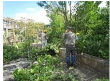
噴水広場横の間伐作業中