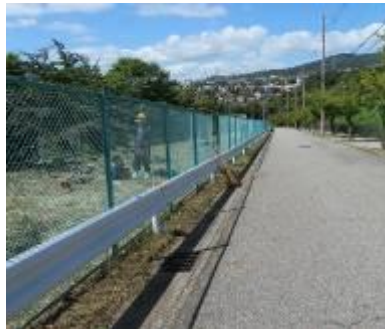
南斜面道路草刈り後