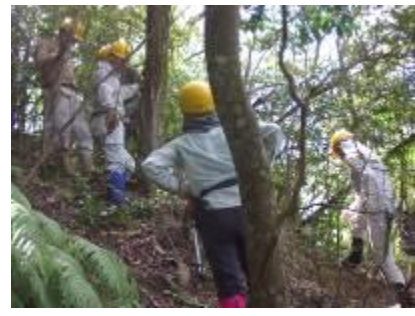
枯れコナラ伐倒方向打合わせ