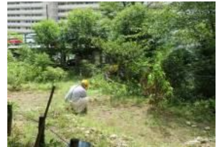
倉庫前広場での苗床の整備