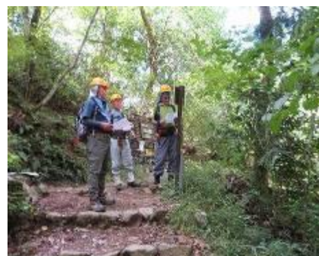
道標整備検討 (エントランス広場入口)

・ その他(園路巡回) 4名で園内の全ルート歩いて、初めて来園した人の立場になって、どの位置にどのように表記した道標を設置したら良いかを検討した。今日の結果を纏めて全体の整合性をみて、最終案に仕上げて行く予定である。今日は比較的涼しくて何とか全ルートを歩くことができたが、随所で伸びた草木が園路にはみ出しているのが気になった。(近藤)