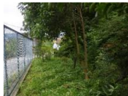
北側道路フェンス際の草刈り