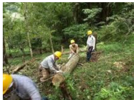
桜坂上部 枯れコナラ伐採木処理