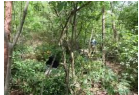
ドングリの丘でのウバメガシ等の除伐