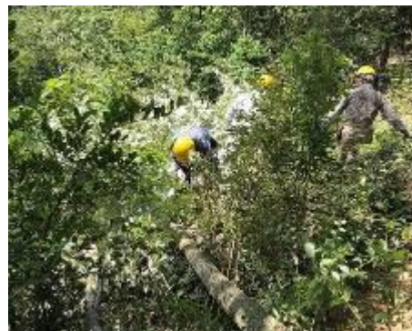
来春、実生サクラを移植するためのポイントを除伐、整備しました。

・ 森の整備② 旧索道の終点(崩落地の上部)に今春植樹した4本のサクラの周辺の林の中で見つけた20数本の実生ザクラの若木を、成育条件を整えるために斜面中央部への移植を計画、当該箇所の間伐を行い場所を確保しました。来春には移植の予定です。(坂田)