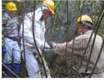
受け口切り・鋸の指導