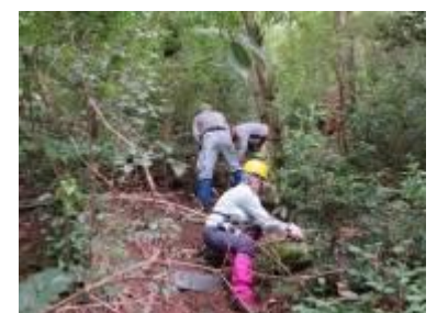
宝松苑道下部の園路整備