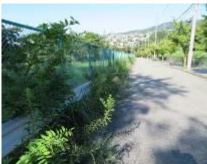
南斜面上道路草刈り前

落ち葉が積もり始めた大階段の清掃を行った。落ち葉を除去し石の間の除草も行い、見違えるようにきれいな階段になった。