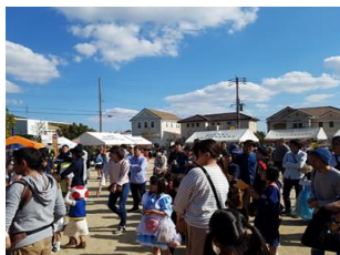
昨年度のお祭りの一コマ