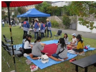
フリーマーケット お宝Get?