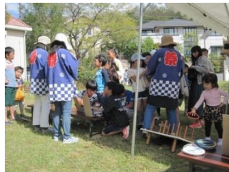
みんなでお祭りを楽しみました♪