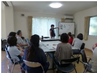
防災訓練の一コマ

今年度も自治会館内ではマジックショー&スクールと骨密度測定が行われ公園では子供縁日(スーパーボールすくい、輪投げ、綿菓子、ポップコーン他)フリーマーケット、花の苗、西谷野菜の販売やCoco壱番屋カレーの販売が行われます。