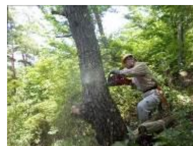
大きな枯れ松の伐採作業

つつじヶ丘、ヤマザクラ林の下部の枯れ松の伐採を行ないました。細い枯れ松とヤシヤブシをまず伐採し、その横の大きな枯れ松を伐採するが、横の大きなソヨゴの上に乗ってしまい、この処理に胴切りを3回行ない、何とかやっと引きずり降ろす。午後からは、一番大きな枯れ松を伐採したが、重心の位置が目測と異なり、予定方向外に倒れるが、処理はスムーズに行えた。帰り道、赤松道ビューポイントから景観に邪魔になっているソヨゴがあり、これを伐採しました。(濱野)