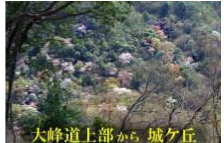
大峰道上部から城ヶ丘

武田尾の桜行脚もだんだん体がきつくなってきました。そろそろ諦めて止めるべきか、あるいは、老いの一徹、恰好良く山中で行き倒れるまで続けるか、悩み多き今日この頃です。