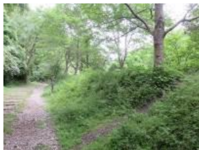
桜ふれあい広場付近 (作業前)

朝からどんよりとして蒸し暑い中、やや少ない人数で作業を行いました。本年最初の廃線敷草刈で4月末から5月の高温と適度の降水で、例年同様に人跡の少ない園路脇等で草木は大きく成長していました。平日で一般ハイカーの来訪は少なめでしたが、安全には十分注意して作業を進めました。前回と同様に4班に分かれ、また作業範囲内の草木の繁茂具合とその広さを考慮して、廃線敷入口付近担当の第1班には刈払機を1台追加し、他班間での応援も行って12時前に、事故もなく作業を終えることが出来ました。