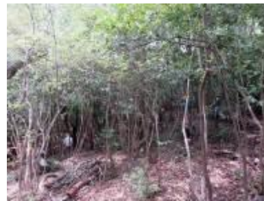
密集したヒサカキの除伐