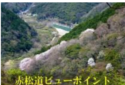
赤松道ビューポイント

個々の桜を見て廻るのとは別に、桜が咲く風景を見通せる場所(ビューポイント)も探して歩いています。2012年に酒井さんと二人で桜坂を見下ろすために赤松道の尾根の背の雑木を切り開いた「赤松道ビューポイント」が今のところ唯一の成果ですが、他に何か所か候補地を見つけています。候補地その1(四辻付近)つつじが丘展望所は普段は何処に丘があるのやらサッパリ分かりませんがヤマザクラが咲く時期だけ「丘の形」が現れます。候補地その2(大峰道上部)城ヶ丘の周りの森の中にはヤマザクラが沢山あり地上からはほとんど見えないが、山の上からなら桜が点在する森が見下ろせます。