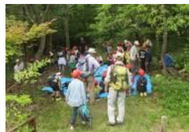
武庫山入口に到着

梅雨入り直前。危ぶまれた天気は良かったが、12時の最高気温は30℃を記録。6班に対し会員2人体制で9時過ぎに徒歩で学校を出発。周囲の街や自然を観察しながら武庫川河川敷、宝塚大橋、南口経由で約40分歩いて学習現場の武庫山に到着。休憩後、標高差100mの地点を目差して急な坂道を登る。途中、里山の自然や樹名板などを参考にして種々の樹木を観察しながらビューポイントに到着して、中山連峰や宝塚の繁華街の眺望を楽しんだ。勾配の急な下り坂を経て出発地点の広場に到着。広場片隅のビオトープ脇の木に産み付けられたモリアオガエルの卵も観察した。短かったが、自由時間を利用して広場周辺の自然を楽しみ、11時15分に学校へ向かって出発。往路とは異なる宝来橋と花の道を歩いて、やや疲れた様子で学校に帰り着き、12:20に学習を終えた。