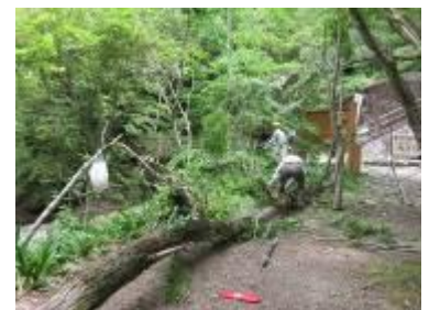
ハリエンジュの伐採(横に倒れる)

親水広場の大きな枯れたハリエンジュを伐採する為、掛かり木になりそうな川近くのハリエンジュを伐採する。倒木のバランスを少しでも改善するため、高枝切で大きな枝を伐採し、チルホールで川側に伐採方向を決めるがチルホールの力ではパワー不足で自重に勝てず、横方向に倒れてしまう。目論見通りにならず、小さなモミジとソメイヨシノの上部の枝一本が被害に遭いました。午後は、台風などの大雨での倒木被害を少なくする為、川の中の頭が折れてしまっていたキササゲの伐採と、小さいキササゲ、カキノキを伐採しました。（濱野）