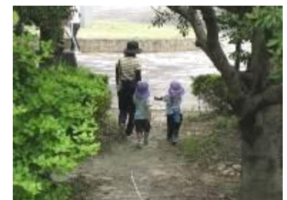
整備した里山こみちを散歩する園児