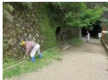
展望広場で園路の草刈と石垣の清掃