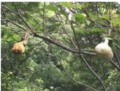
真ん中の池のモリアオガエルの卵塊5つ

池の水がほとんどなくなっているが、今年もモリアオガエルは産卵し、卵塊が8つあった。真ん中/北端の池上の木に5つ、山側/南端の池上に2つ、ほとんど涸れあがっている一番下の池にはなし。今は池に水が少しはあるが、梅雨入りが遅れたり空梅雨になったらどうなることか? あとの一つは育苗畑横の桜の木に、貯水浴槽の上に。上と言っても80cmぐらいずれている。水たまりを探して苦労したんでしょうが、こちらはどうなることか?