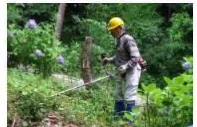
アジサイロード側公園の草刈り

午前中は、ツツジが丘のかなり大きな枯れ松の伐採とコバノミツバツツジ群落の間に生えている雑木の伐採を行った。午後は、里山こみち内で生い茂った常緑低木の伐採・枝の剪定を行った。