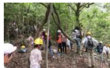
キツネの森で寛ぎのひとつ