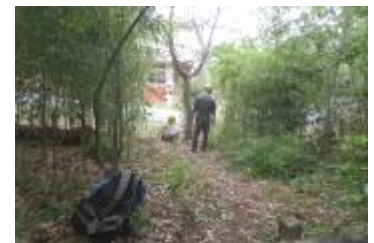
環境学習時の通路整備