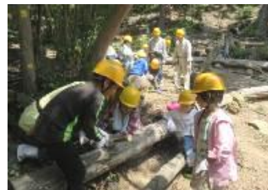
各班に分かれてノコギリ体験

と、五感で自然を感じそれぞれに発見があったようだ。何を見つけましたか？ ツツジの花、リョウブという木・・・次々と声上がる。ノコギリ体験は直ぐに上手に切れる様になりいくつも輪切りの木を手にして喜ぶ。自然に興味を持ち大切に、地球の未来を考える人になってください。「櫻守になりたい人？」・・・チラホラ。また秋に会いましょう！子供達には何時も元気をもらう私達です。