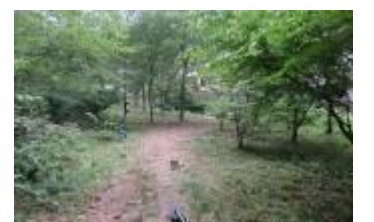
草刈を終えた県宝谷入口平