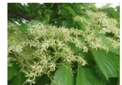
南斜面 白いクマノミズキの花