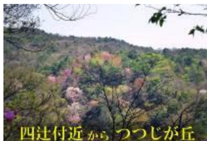
四辻付近からつつじが丘