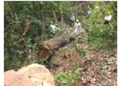
南谷左岸の枯コナラ伐採

南堰堤左岸の平地で残っていた大枯コナラをチルホールも使って伐採処理した。伐倒はうまくいったが、大枝処理の時、幹が想定外に回転してヒヤリハットとなった。倒木が安定な状態になったか十分な確認が必要と思った。コナラ伐採後は南堰堤左岸を中心に常緑を除伐して作業道付近をすっきりとさせた。東口側には枯コナラ、枯ザクラがあったが秋以降の作業とした。