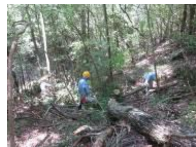
枯れコナラの処理

前回倒したまま処理未完の枯れコナラ処理のため、滝見の道を登りササラ沢から遠見の道へ入った。園路を遮り、周囲の木にまだ掛かったままだったが大鋸で少しずつ処理を進め、主幹は玉切りして土留め状に整理し終わるのに午前中一杯かかった。昼食後は、外周路を四辻に向けて進み、ウラジロが密生し園路を圧迫している部分を刈り取り、更にソヨゴの園路に覆いかぶさっていたものを伐採し、路肩を補強した。ソヨゴの処理に時間をとられ、作業はここまでとなった。(坂田)