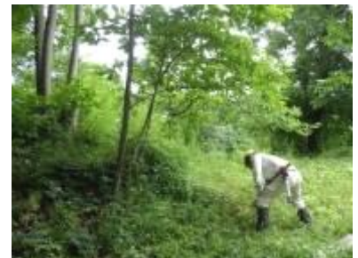
広場斜面でタケ切り、ササ刈り

11時ごろに雨が降り出し、作業を中断して様子を見たが止む気配がなくそのまま終了した。