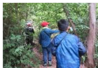
歩きながら樹木を観察