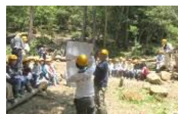
木の成長について説明を聴く

中山桜台小学校の学校林にて新3年生を迎えて1回目の体験学習を行った。児童たちは少し緊張した表情で学校林に到着。何やらおとなしい。しかし学習が始まると、質問に手を挙げ徐々に活発になってきた。環境という言葉から、動かない植物と動く鳥や虫、人間との関係を学ぶ。難しかったかな？次は班の木を探しに林の中を移動し、ある班はどんどん上の方へ、ある班は座って櫻守の人の話を聴いたり・・・