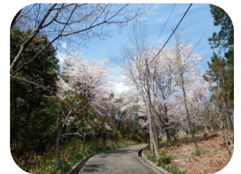
山本山手まちづくり協議会 あじさいロード保善委員会