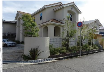
③-5 仁川台地区内の住宅外構(緑化修景の良い事例)