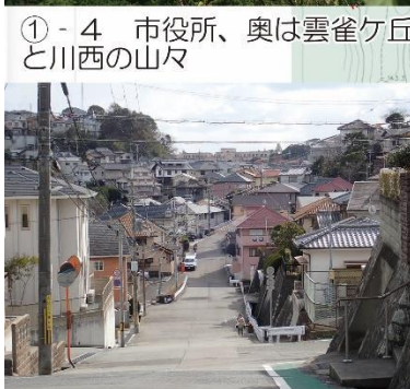
①-4 市役所、奥は雲雀ヶ丘と川西の山々