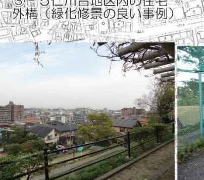
⑤ 仁川台北公園から競馬場などを展望