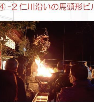
④-3 熊野神社の節分護摩火焚き祭り(塩がかかった御幣は燃えずお守りになる)