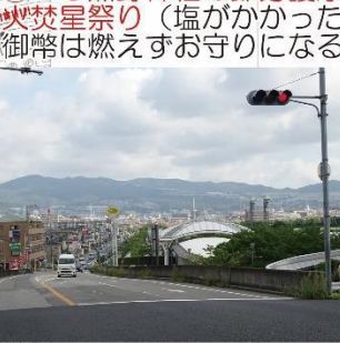
⑥-2 小仁川沿い通路から六甲山系の山並