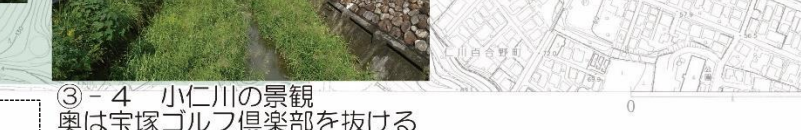
③-4 小仁川の景観奥は宝塚ゴルフ倶楽部を抜ける歩行者道(バイクはOK)