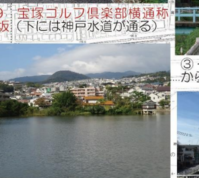
④-1 弁天池と甲山、六甲山と浮御堂