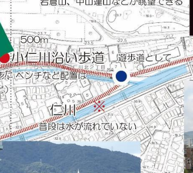
⑥ 小仁川沿い歩道(遊歩道として)