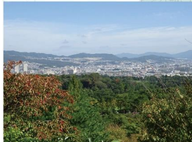
①-2 中山連山、中山台、山手台