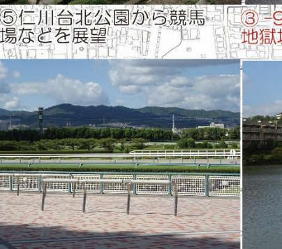
⑦-1 阪神競馬場から中山連山を望む