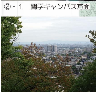
②-1 関学キャンパス方面