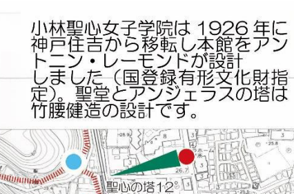
小林聖心女子学院は1926年に神戸住吉から移転し本館をアントニン・レーモンドが設計しました(国登録有形文化財指定)。聖堂とアンジェラスの塔は竹腰健造の設計です。