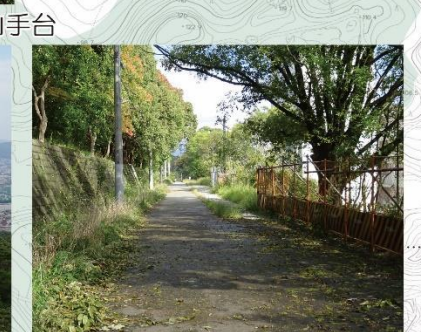
③-3 宝塚第一中学校横の通路下には神戸水道が埋設