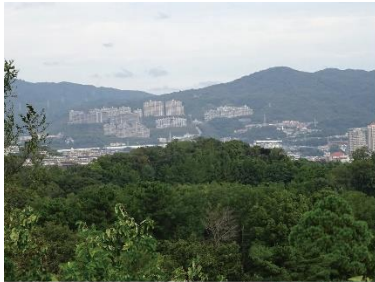
①-1 すみが丘・ラビスタ