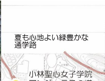
夏も心地よい緑豊かな通学路