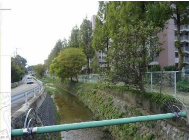
③-2 UR 仁川団地小仁川沿いのメタセコイア並木