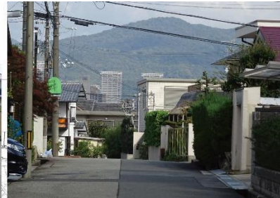
③-6 仁川台から中山奥の院の山 高司中学校