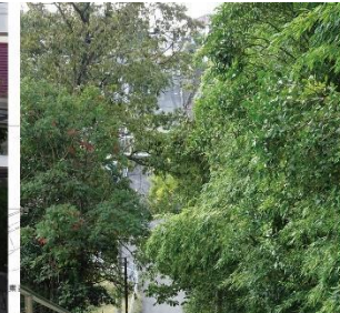
③-7 宝塚第一中学校横の通称百段階段(下には神戸水道が通る)