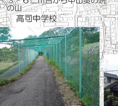
③-9 宝塚ゴルフ倶楽部横通称地獄坂(下には神戸水道が通る)