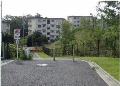
③-1 UR 都市機構の旧スターハウス