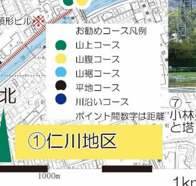
⑦-2 阪神競馬場から小林聖心女子学院の建物と塔