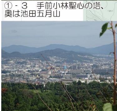
①-3 手前小林聖心の塔、奥は池田五月山