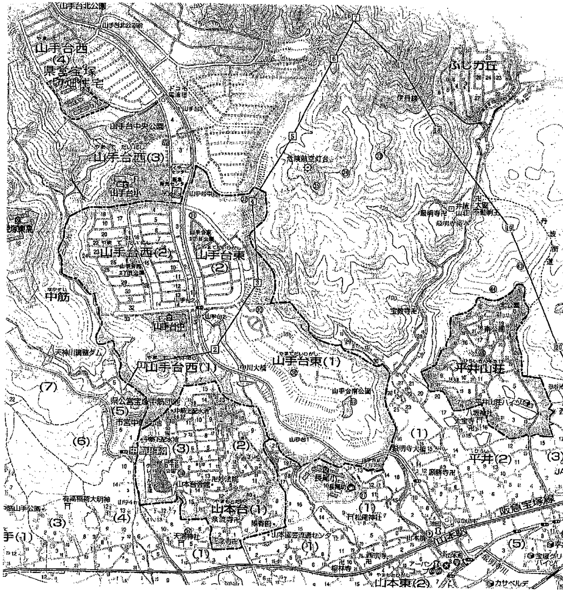
* 地図上の○囲みのNo. は市資料による古墳所在地No.。 山手台8基、平井山荘3基、山本台1基。

これら4自治会の地域背景の違いから派生する、異なる問題点や要望を、どの様に対応解決するかが、今後のコミュニティの課題と考えます。