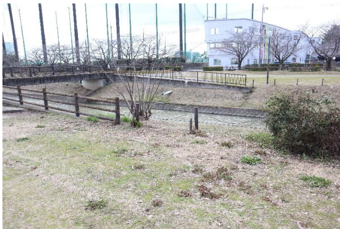
⑱橋の北東側落下防止柵を撮影