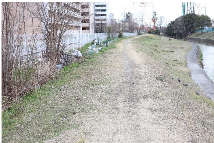
⑩別の畑が造成されている所を撮影