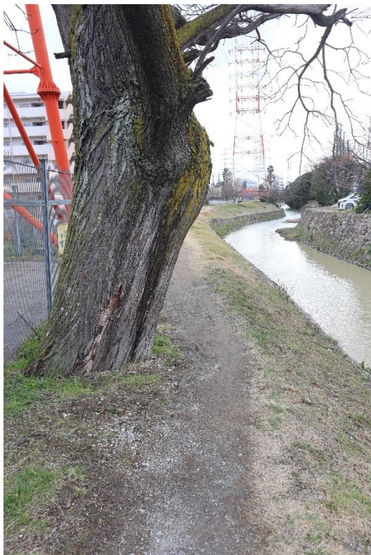
⑧同、樹木部分を撮影

※鉄塔横は元々道幅が狭いが、さらに樹木がある為に、自転車での通行もかなり困難な状態となっている。落下防止柵や路肩の整備もされていないので、かなり危険な場所と言える。