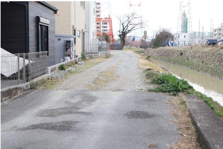
⑤路面/アスファルト舗装最終部を撮影