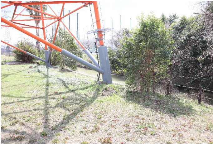
⑬同、鉄塔の護岸部分を撮影