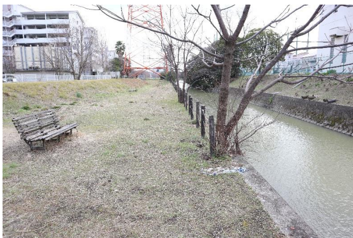
⑬護岸および、落下防止柵を撮影