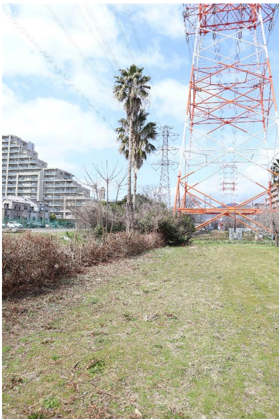
⑰鉄塔および、ヤシの木を撮影