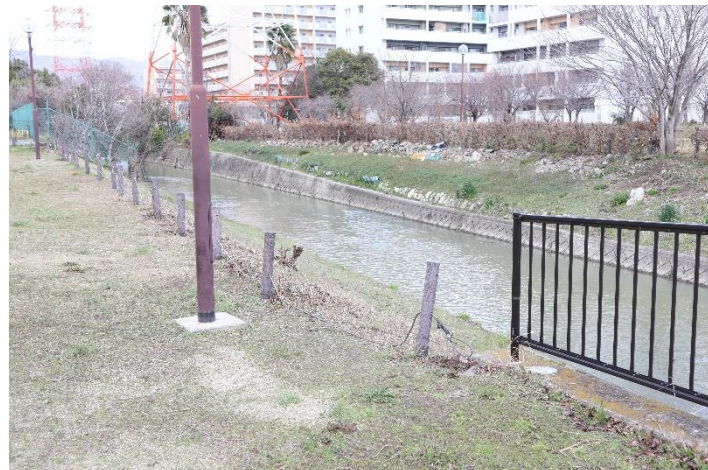
⑲橋の北西側落下防止柵を撮影