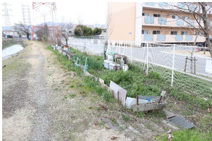
⑪畑を反対方向(南側から北側へ)から撮影