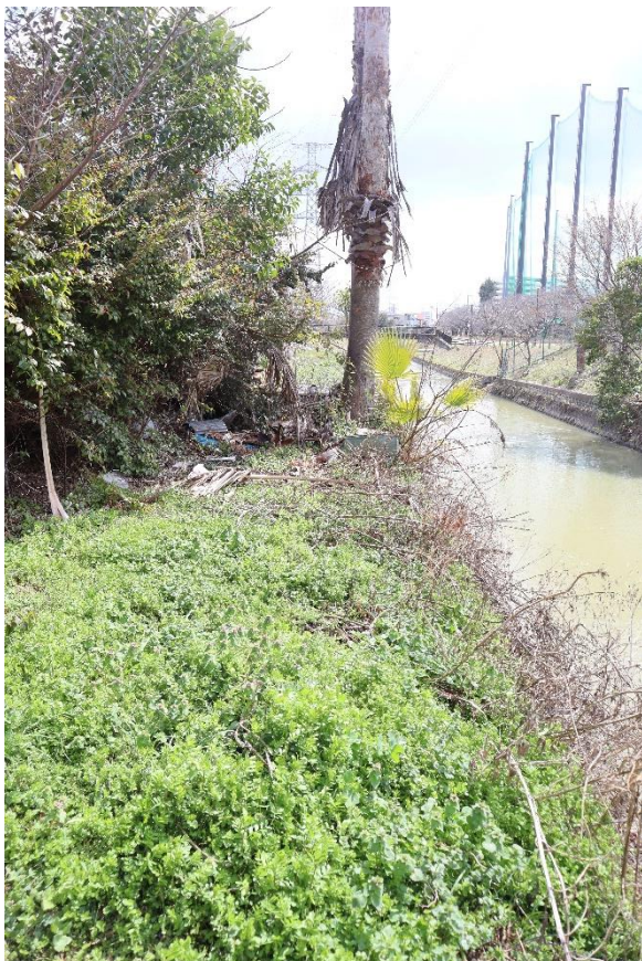
⑭鉄塔南側から護岸に入れる部分を撮影