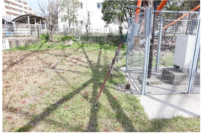
⑬同、鉄塔下にある設備を撮影