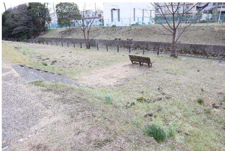
⑫道路(歩道)からベンチを撮影 ※ここからコンクリート路面となる。