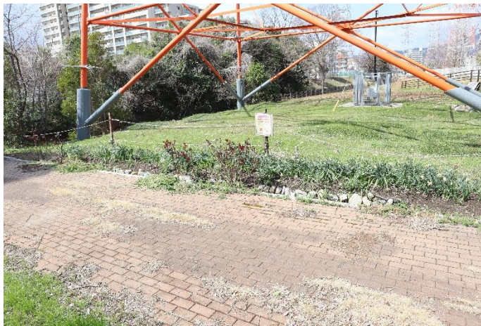
⑬同、鉄塔を南側から撮影