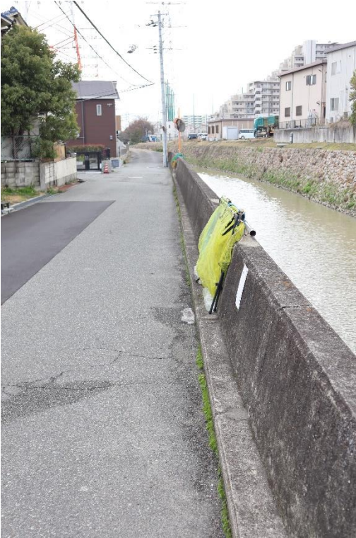
③川の護岸(立ち上がり)状況を撮影