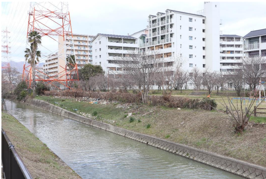
⑰護岸、土手部分を対岸より撮影

※護岸が下がり、土手の斜面部分が増えるのに合わせて、波板などを使用して簡易な護岸が作られているため、崩れやすい足場となっており、知らずに近寄ると危険な状態となっている。