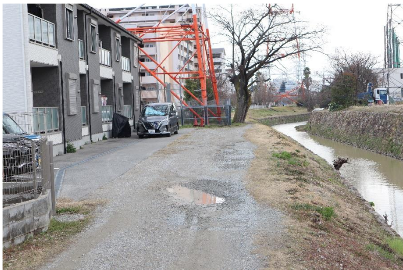
⑦車両(4輪)が進入できる最終部を撮影

※鉄塔の手前まで道路(?)として集合住宅の駐車場へ出入りする為に利用されている。※電力会社の点検などよりも利用頻度が高い。(落下防止柵や路肩の整備はされていない。)