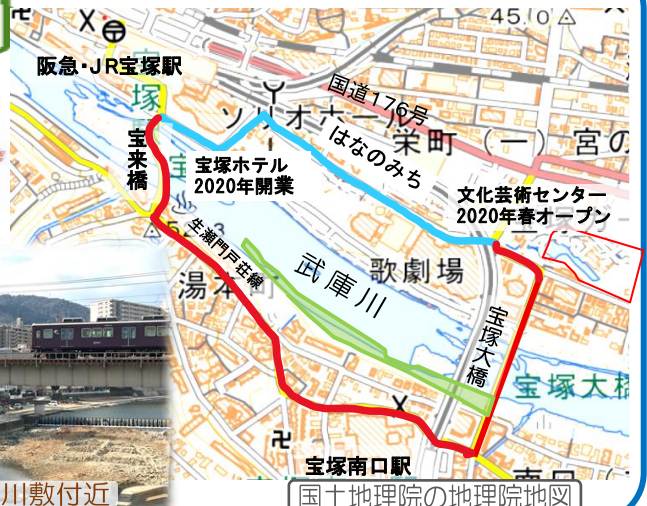
国土地理院の地理院地図