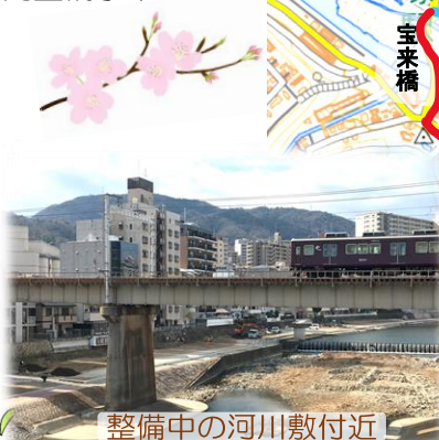
整備中の河川敷付近