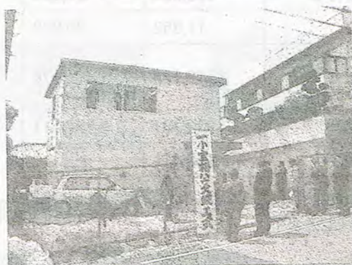
一小宝梅ハウス外観