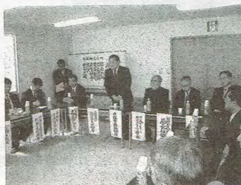
阪上市長のご挨拶