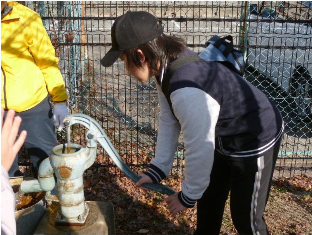
防災井戸からポンプより水汲