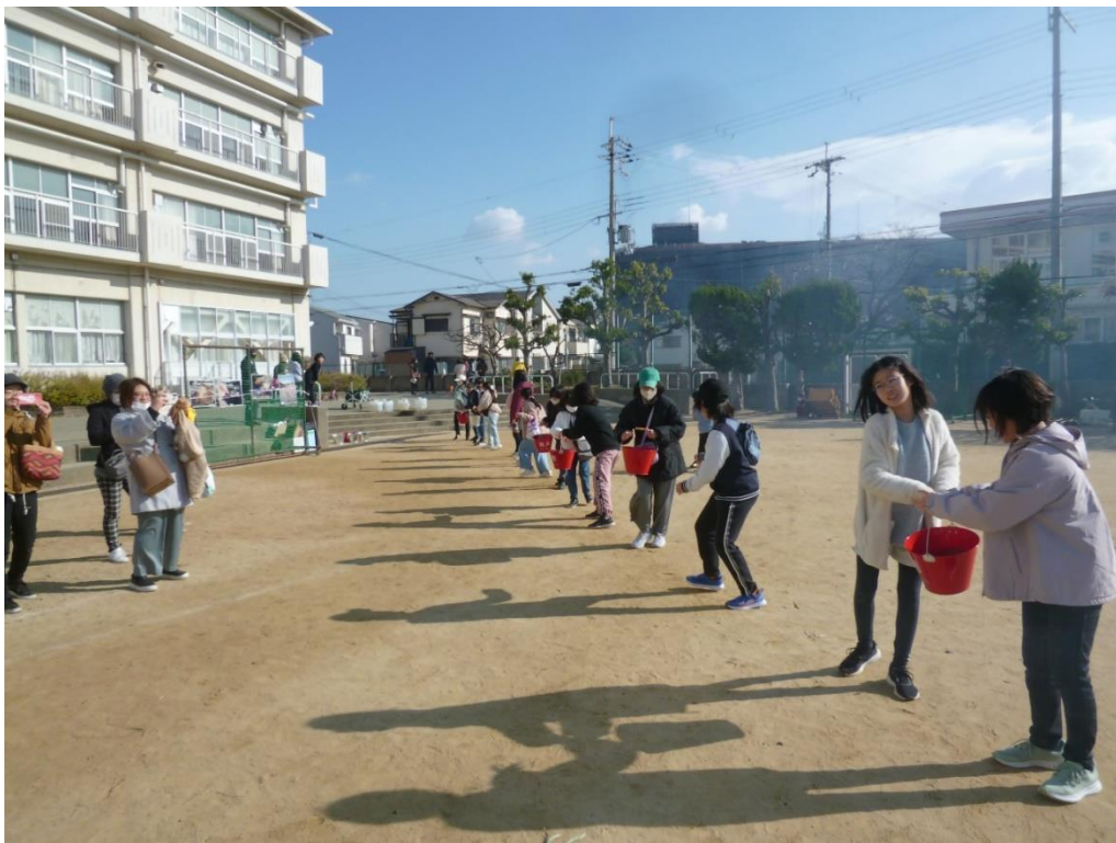
井戸水をバケツリレーでとんどの火消し