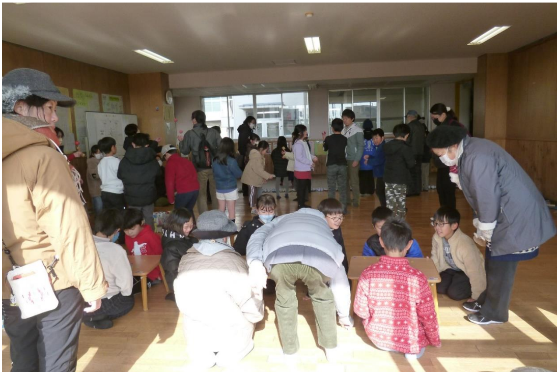
お年寄りの手ほどきで実際に光明体験