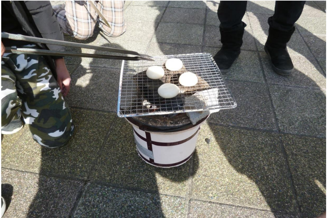
パック入の餅を各自 1 個焼く