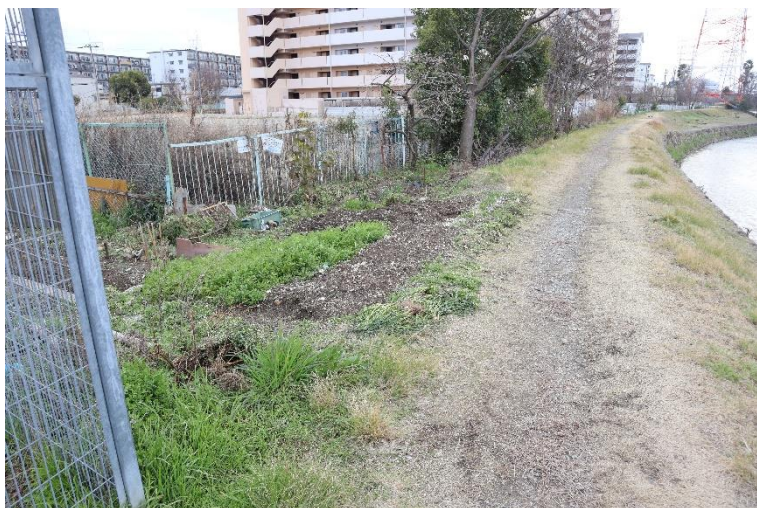
⑨鉄塔横、畑が造成されている状況を撮影