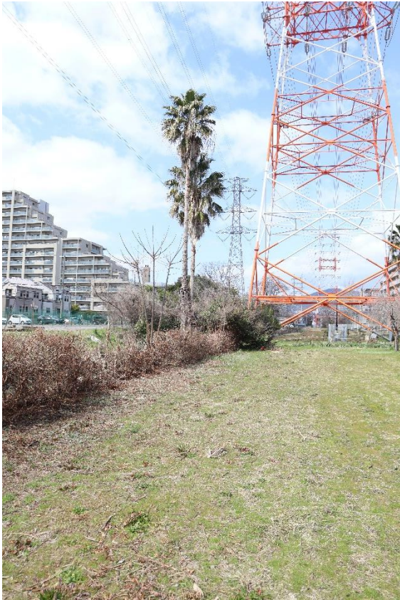
⑰鉄塔および、ヤシの木を撮影