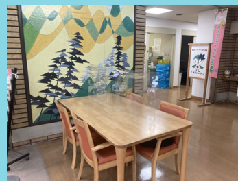
建物内のオープンスペースを クールシェアスポットに！

また、夏の節電対策や熱中症対策にもなり、環境や健康にもプラスの価値を生み出します。