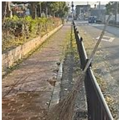
もうすぐ坊主のくすのき1号

25 日が🌧️で✕。26 日は活動日で✕。 で、本日27日 (木) 朝参上。これだ→ 三度目?のごっついとっ散らかり様に思 わずくゴ🍂です。((´▽`))v 燃えたぎる闘志🔥 前回\(^o^)/ この🍂歩道の道路挟んで右側の児童 館歩道も緑っ葉🍃洪水状態(;´Д`)ス トっピストっピだよ〜(@@)ー🍃🍃 2日間放っとくとうなる時期ですから、 🌧️よ少々待って欲いですわ。 後半戦、どこからか〈ホワイティ〉が参戦 しに来てくれた🧹 『横通ったら🚗。))Black が掃き掃きして たから降りて来た👤』サンキュー👏 「病気やから放っていいんだよ👤」 「知ってるう💖」つうてせっせと掃き活致 しました。本日の収穫は5袋なり。