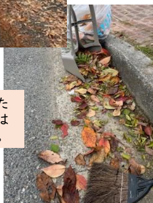
今まで緑っ葉🍃だった 花壇側エリアが今日は 🍂に変わってたぞい。