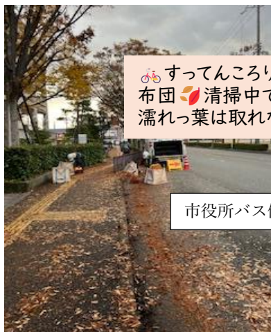
🚲 すってんころりんの先では 布団🧹清掃中でした。 濡れっ葉は取れないんだよ👤