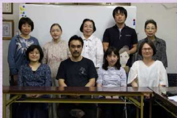
御殿山北自治会役員のみなさん