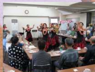
開催時の様子です