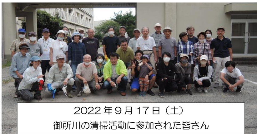
2022年9月17日（土） 御所川の清掃活動に参加された皆さん