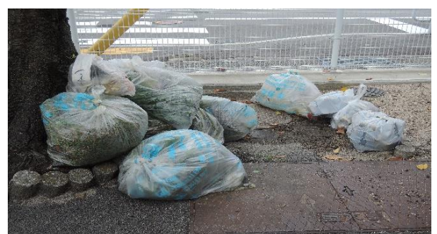
御所川から収集分別処理したごみ