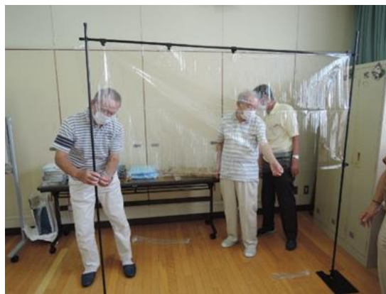
飛沫防止ガードセットの組立