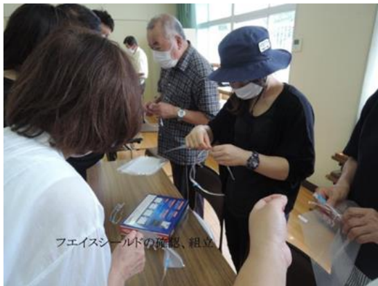
フェイスシールドの組立