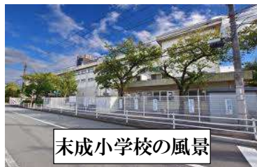
末成小学校の風景

本校は、地域の皆様との関わりが多いことから、いろいろとお力添えをいただくことになろうかと思っております。子どもたちの健全な育成には、子どもを真ん中に置いて、学校・家庭・地域が互いに協力し、見守っていくことが大切です。皆様のご理解とご協力をお願い申し上げます。