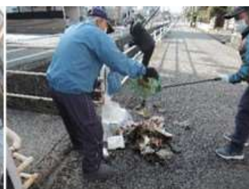
水門より収集したごみ