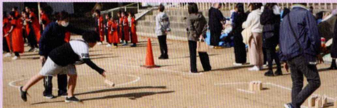
モルック体験コーナー