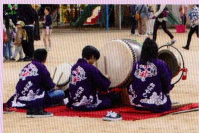
小林地車保存会鳴り物