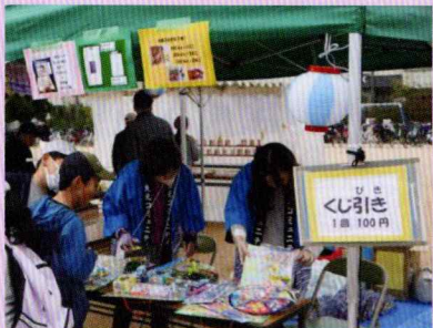
くじ引きコーナー