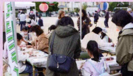
クリスマスリースづくりコーナー