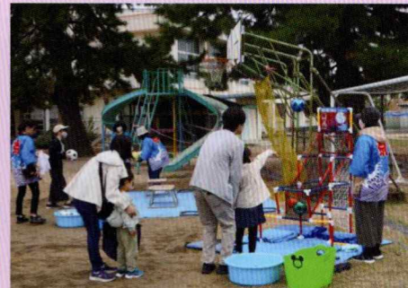
バスケットゴールコーナー