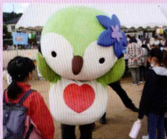
スミレンが来てくれた