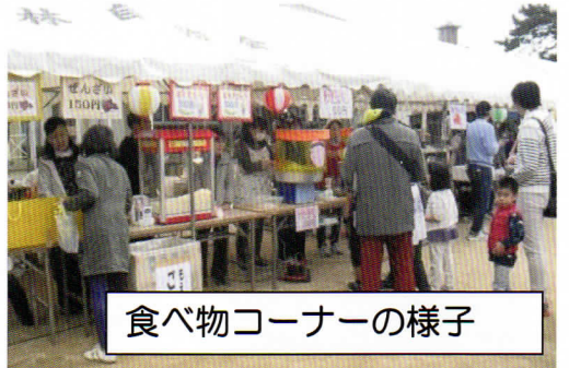
食べ物コーナーの様子