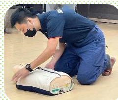
安全を確認し近づき、意識確認！