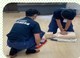
AEDの音声に従い、電気ショックと胸骨圧迫を繰り返す！