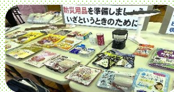
来年は数量限定で販売する方向で！