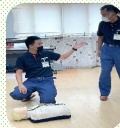
「あなたは、AEDを持ってきてください」と指示