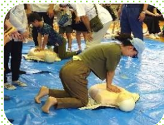
参加者全員が体験