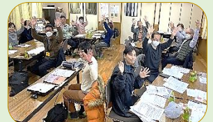
最後、手をひらひら～手話のひとつで感謝を