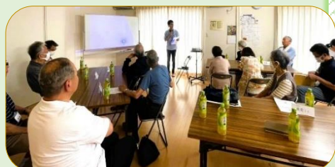
要援護者の方々と支援メンバーとの交流会