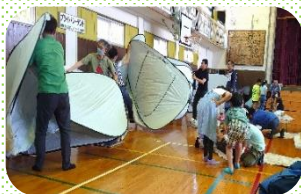
テントが意外に大きく悪戦苦闘！