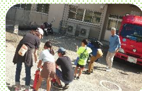
来年は大人も全身体験しましょう！

その後は、2組に分かれ消火訓練とAED訓練を体験。宝松苑出張所から4名の方が指導に来られ、消火訓練では消火器の使い方を説明後、的に向かって消火器を使う訓練を体験。