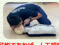
可能であれば、人工呼吸も