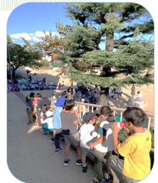
未来を担う軍団「西山っ子」

今、社会には解決しなければならない問題が山積しています。私たちはその課題や困難を乗り越えていかなければなりません。子どもたちは将来、それぞれの場面で社会の問題解決を担う人として成長していきます。「西山っ子」にはその力があります。そのために今は力をつける時です。授業をしっかりと聞き、友だちとなかよく協力できるコミュニケーション能力を身につけ、人格を磨いていくことが大切だと思っています。本校の卒業生の皆さんが積み上げてきたように、社会に出た時に十分な力を発揮できるよう今は、子どもたちにしっかりと学んでほしいと思います。