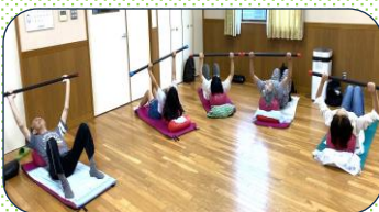
筋肉トレーニング