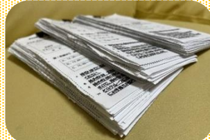
3グループに分けた申込用紙!

最終的に子ども300名 保護者180名、合計480名!! 何とか第2希望までで3つのグループに分けることができました。