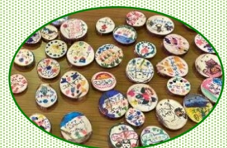
カラフルな銘板完成!