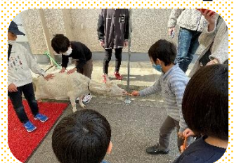
勇気を出して「どうぞ〜!」