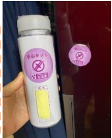
「安心キット」 高さ20cmくらい円筒