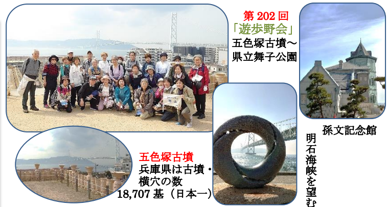
第202回 「遊歩野会」 五色塚古墳～ 県立舞子公園