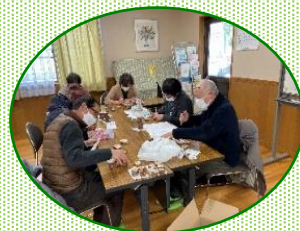
手分けして300枚の切り株に草木の名前を書きました。