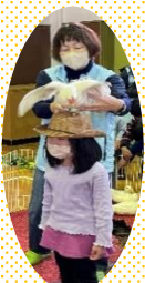
チャボの頭乗せに挑戦!