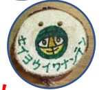
ニシヤマンも登場!