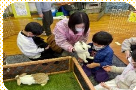
うさぎちゃん、かわいい〜!