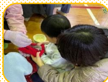
ハムスター、手袋をしてそ～と抱っこ。「ちゅっ!」