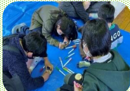
集中して色塗り中