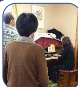
杉本先生指導「ドリーム西山」お腹から声を!