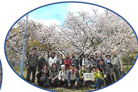
上 20190412-淀川河川敷 下 20141114-大文字山