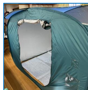
テントはゆったりしています。畳2畳くらいの広さ。