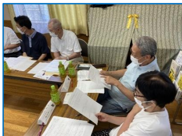
第1回。お隣同士で書いたものを見せ合いました。