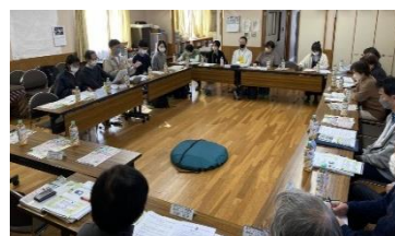
第2回。真ん中にテントを置いて説明を聞きます。緑色で丸いものが「テント」たたまれた状態です。

避難所についてはトイレのバリアフリー化や寒さ対策、備蓄物資の優先的な利用のあり方、スピーカーによる案内と同時に、光で知らせること、大きく書いたもので情報共有することなど、ハード、ソフトの両面にわたり、様々な意見がでました。体験の実施も大切です。新型コロナ感染防止をしながら防災訓練を復活させたいという思いを持ちました。