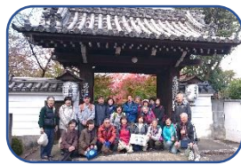
上 20191114-青蓮院～將軍塚 下 20180413-姫路城

顧みれば本当にいろいろなところを歩き巡りました。今再考したい場所があっても建物消滅・山道閉鎖と、寂しい思いを・・・歩いていて良かったと思うばかりです。今後も続いていきます。楽しい歩きを求めて！S記