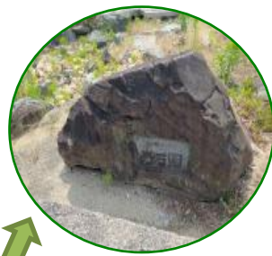
東京オリンピック記念という銘板の石…残したい！

西山小学校に残っていた57年前の計画図。火成岩、堆積岩、変成岩というゾーン分けがあったようです。