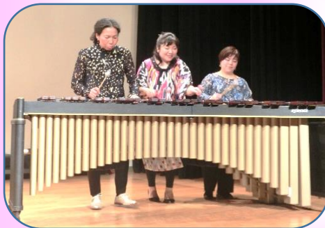
楽しそうですね? 聞いている者も 楽しくなりました