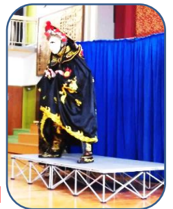
昨年の変面ショー