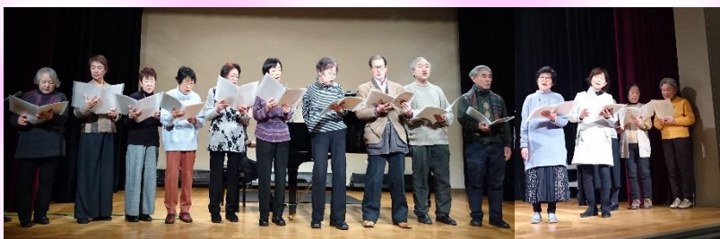
日頃参加されている皆さま。お腹から声を・・・と!

4曲目から「さあ～みんなで・・・」会場の方々も大きな声で。こころが軽くなるような、また、懐かしさも一緒に運んでくれました。大きな声を思いっきり張り上げることの大切さも・・・。