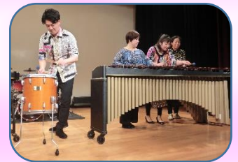
曲「熊蜂の飛行」演奏中。4人が目まぐるしく 移動しながら奏でる音色は 打楽器ならではの迫力!