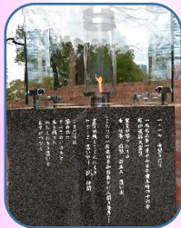
1.17 希望の灯り。 燃え続ける灯り。東遊園地内