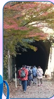
毎年7月と12月は ミステリーツアー～と称して 親睦会を。昨年12月の様子。