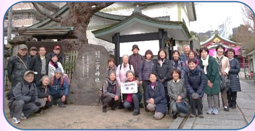
二宮神社 震災の傷跡が残って

「よく歩いた～」という感が・・・。「200回!!」何年か前は本格的な山歩きも・・・。時間は私たちとともに過ぎ、体力を思いやる年齢になり、歩くところも変化してきました。でも、「歩く」という目的に変わりはありません。より楽しく、時には勉強時間となり、好奇心の刺激に・・・。下見をしっかりとし、皆さんとともに、安全に長く続けていけるようところがけていきます。