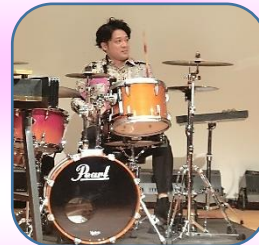
12個以上の打楽器担当