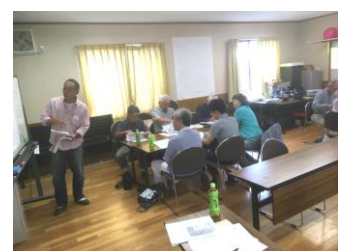
第8回委員会の様子と模造紙の成果物の一部