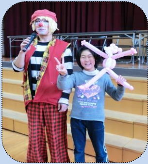
「クラウンなし」さんが風船で作った「ピンクパンチ」ゲット!

3月。年度最後の大きなプログラム。 「何が出てくるの?」「今度は何?」ピエロ「クラウンなし」さんの笑いを誘うひとつひとつのパフォーマンスに引き込まれました。歓声の渦 ウズに…。 参加者 250 余名が大人も童心に帰り、子供たちと一緒にわいわいと走った、笑った一日でした。