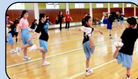
30分かけてストレッチ!