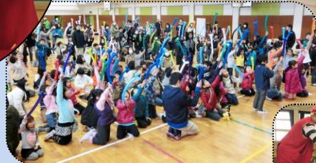
「クラウンなし」さんから全員に配られた風船。「キュッ!キュッ!」「ワッ!犬になったよ」