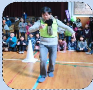
お父さん方も大ハッスル。親子で楽しめるのも魅力!