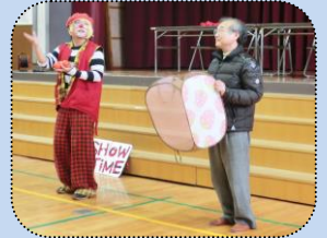
「クラウンなし」さん

3月。年度最後の大きなプログラム。 「何が出てくるの?」「今度は何?」ピエロ「クラウンなし」さんの笑いを誘うひとつひとつのパフォーマンスに引き込まれました。歓声の渦 ウズに…。 参加者 250 余名が大人も童心に帰り、子供たちと一緒にわいわいと走った、笑った一日でした。