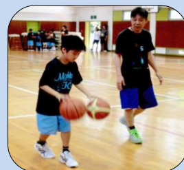
右手、左手とむつかしいドリブルを