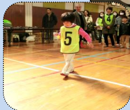
ミニ運動会「スプーンレース」 “慎重に!でも早く～!”