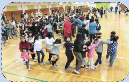
全員でじゃんけん列車ゲ〜〜ム。 「最初はグ〜!じゃんけんポン!」 「よし!勝った!」

「クロスロード・クイズ」防災について○×形式で出題。子供たちにはちょっとむづかしかったか!