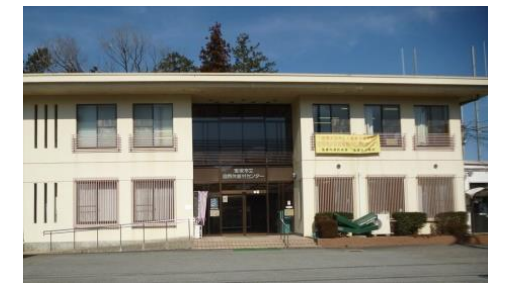
現状の自然休養村センター

本年9月に、自然休養村センターを廃止し、西谷地区における行政防災拠点とするための耐震改修工事を行います。工事期間中は施設を閉鎖し、北部振興企画課の執務室は、北部整備課に一時移転します。（東消防署西谷出張所は現在の場所で引き続き執務を行います）来春、工事完了後は、西谷サービスセンター、北部整備課、北部振興企画課、東消防署西谷出張所が集約されます。工事のスケジュールや新たな施設の利用開始日などは、随時お知らせさせていただきますので、ご理解とご協力をお願いします。