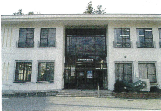
▶西谷庁舎正面写真