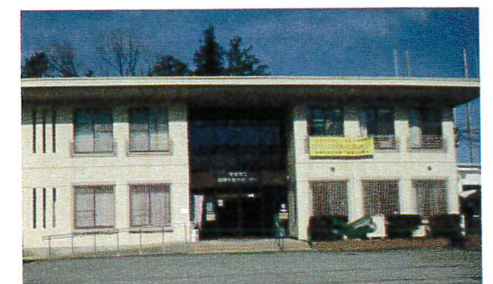
現状の自然休養村センター

本年9月に、自然休養村センターを廃止し、西谷地区における行政防災拠点とするための耐震改修工事を行います。工事期間中は施設を閉鎖し、北部振興企画課の執務室は、北部整備課に一時移転します。（東消防署西谷出張所は現在の場所で引き続き執務を行います）来春、工事完了後は、西谷サービスセンター、北部整備課、北部振興企画課、東消防署西谷出張所が集約されます。工事のスケジュールや新たな施設の利用開始日などは、随時お知らせさせていただきますので、ご理解とご協力をお願いします。