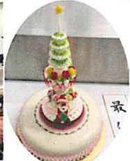
2015西日本洋菓子コンテスト 最優秀賞受賞作品

告げられコック服を渡されました。これが私のパティシエとしての始まりで、そのケーキ屋さんでは4年半お世話になりました。あの時、オーナー夫婦にコック服を渡してもらわなければ今の私はないと思います。その後も壁にぶち当たり、たくさん泣きました。しかし、その経験が少しずつ私を強くしてくれたのです。