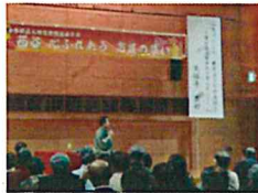
(平成29年度人権学習会)

日時：平成30年11月17日(土) 13時30分～15時30分 場所：西谷ふれあい夢プラザ